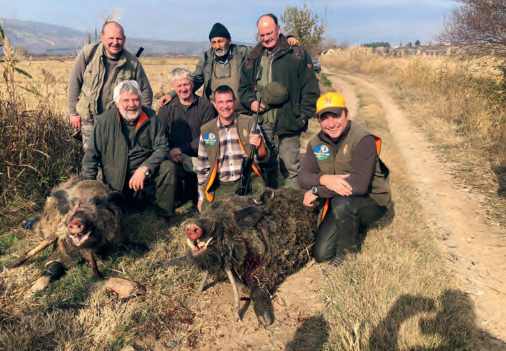
Egy szép terítékfotó a társaimmal

lalt meg a puskája, és a kan végül elfeküdt a rizstarlón.