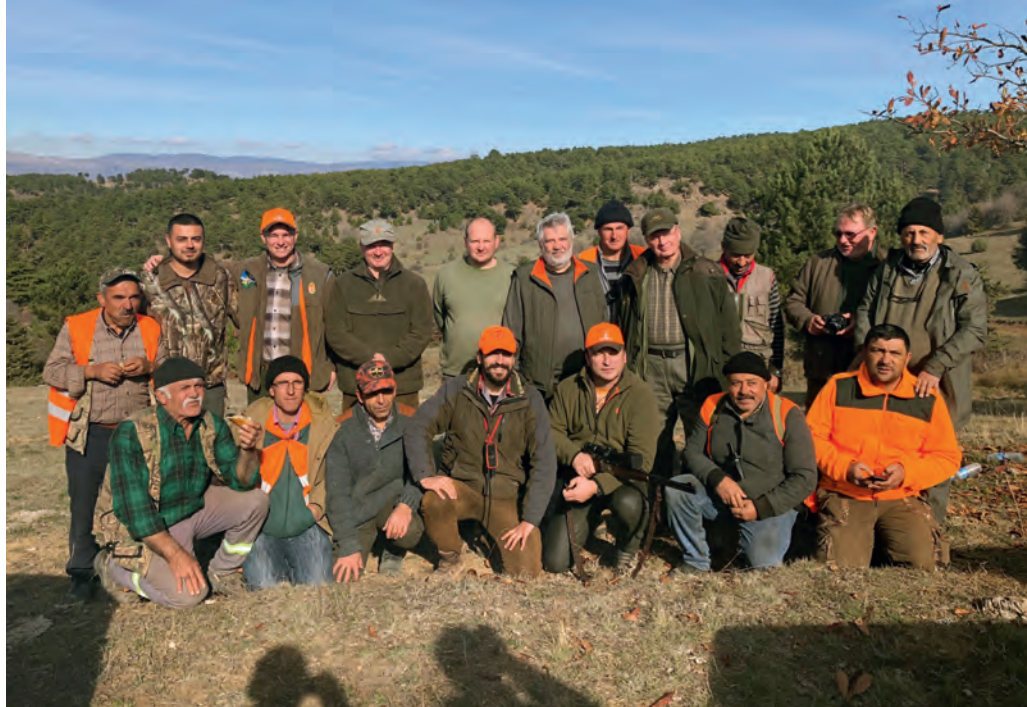
Közös fotó a hajtókkal

Az első hajtásban a hegy alsó harmadában foglaltam helyet, velem szemben két hegy és a közöttük lefutó völgy. A hajtás a hegytetőről lefelé felénk tartott. 8 óraker a kutyák disznókondára találtak, amit a hegy másik oldalára űztek. Fiam ott legalább 20 disznót látott, és szólt a puskaszépen. 10 óraker jöttek értem.