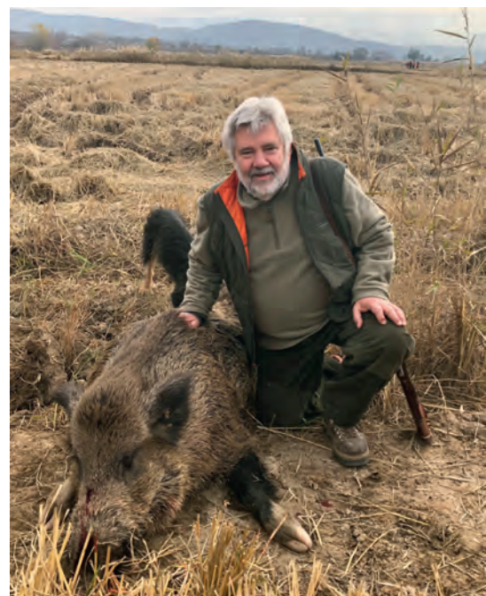
A rizsföldön lőtt nagy kanommal

Törökül megköszönve mindet: tésekür edirim! 🐾